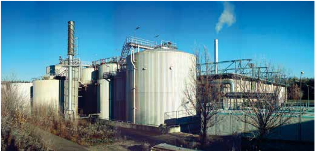
Die Biovergärungsanlage in Brunenthal-Kirchstockach.