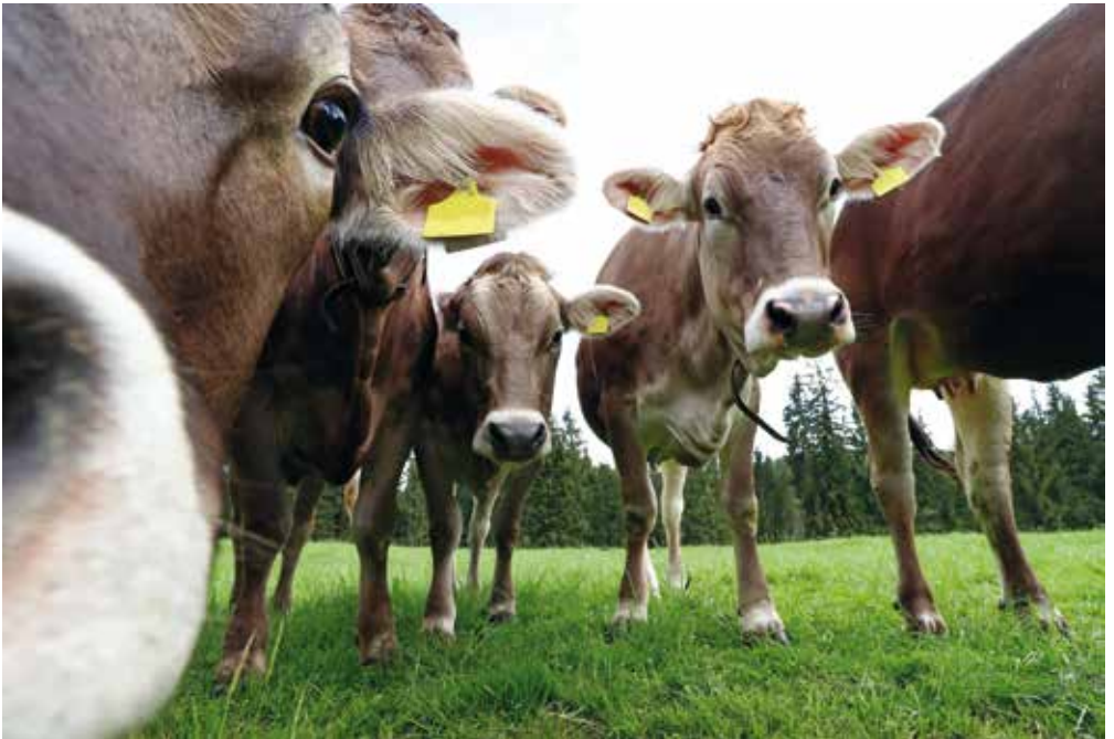
Salopp gesagt: eine Biovergärungsanlage ist auch nur eine Kuh.