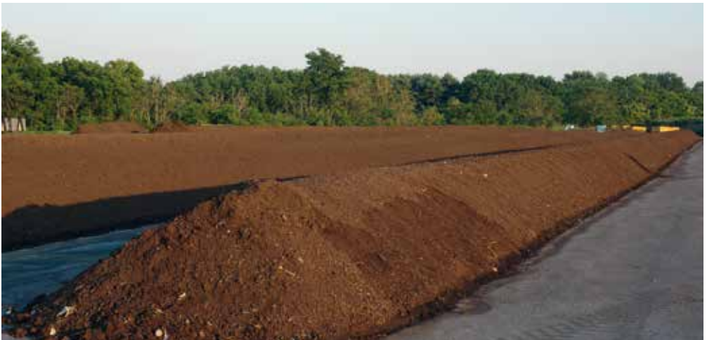
Sogenannte Mieten oder Haufwerke.

Im mittleren Teil dieser Broschüre finden Sie eine Liste der Stoffe (Trennliste), die über die Biotonne im Landkreis München gesammelt werden sollen. Daneben finden sich die Stoffe, die nichts in einer Bioabfalltonne zu suchen haben – und zwar aus guten Gründen.