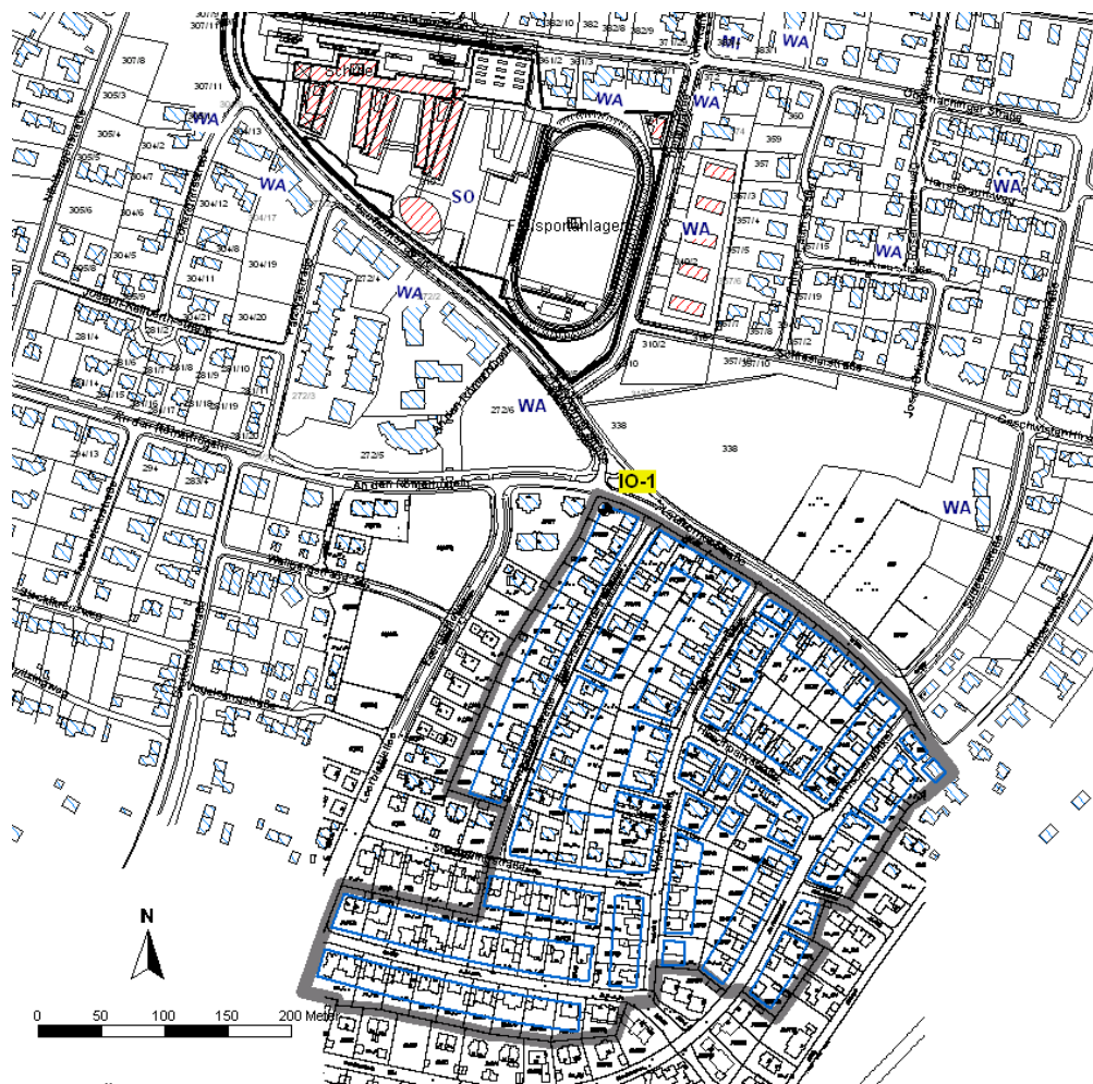
Abb. 1: Übersichtslageplan mit maßgebendem Immissionsort (IO-1)

Die Lage des Bebauungsplangebietes [2] sowie des Gymnasiums Grünwald sind aus nachfolgender Abbildung 1 ersichtlich.